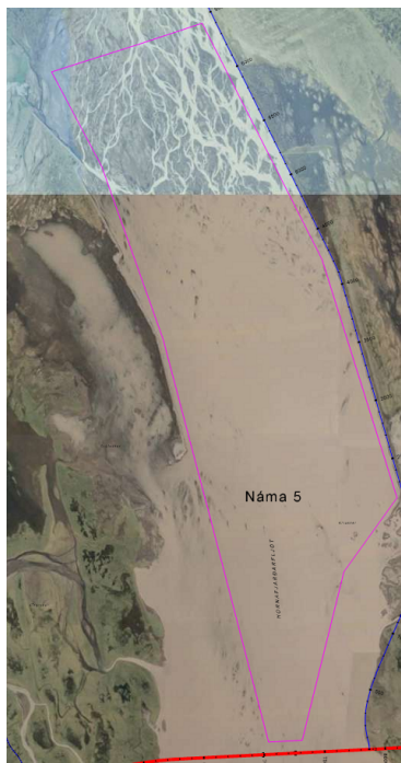
Mynd 3. Deiliskipulagssvæðið

Svæðið er skilgreint í aðalskipulagi sem efnistökusvæði 34 (E34) og nefnist Náma 5 Hornafjarðarfjót. Á vesturbakka fjótsins er landnotkun flokkuð sem opið svæði. Á austurbakka er landnotkun skilgreind sem skógræktar og landbúnaðarsvæði, rofsvæði.